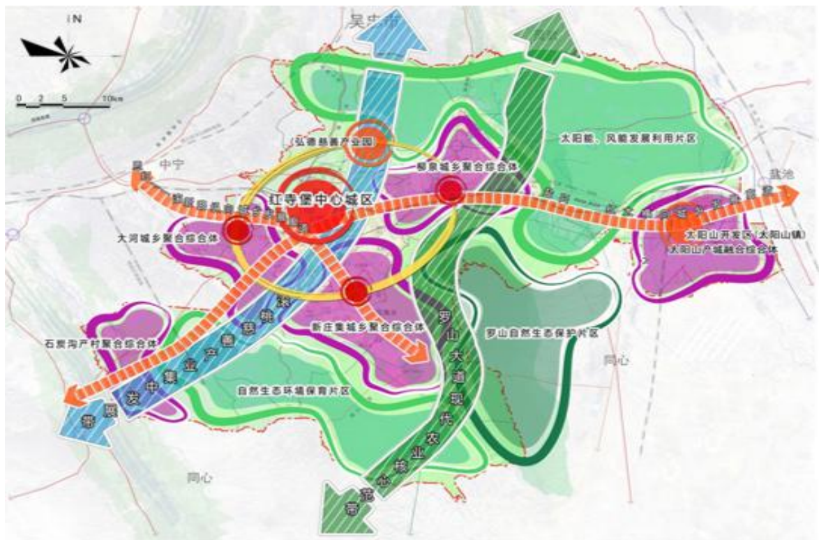
图 3：城乡空间结构图